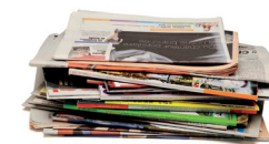
Journaux, catalogues, prospectus