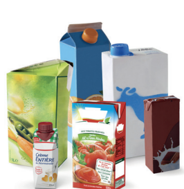
Briques alimentaires, sacs et films, emballages métalliques