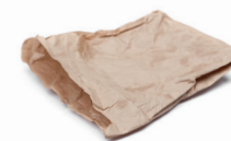
Tous les emballages en carton