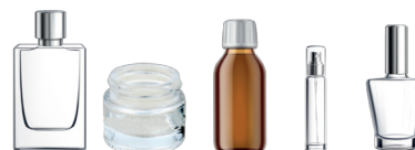
Flacons et autres... (crème de soins, parfum, sirop...)