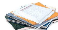
Cahiers, bloc-notes et impressions