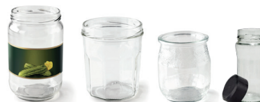
Pots (légumes, confiture, yaourt, épices)