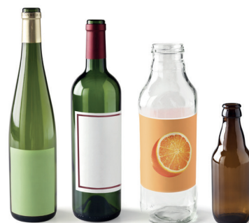
Bouteilles, canettes et bocaux