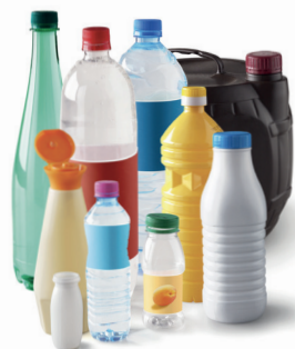
Bouteilles, bidons et flacons en plastique