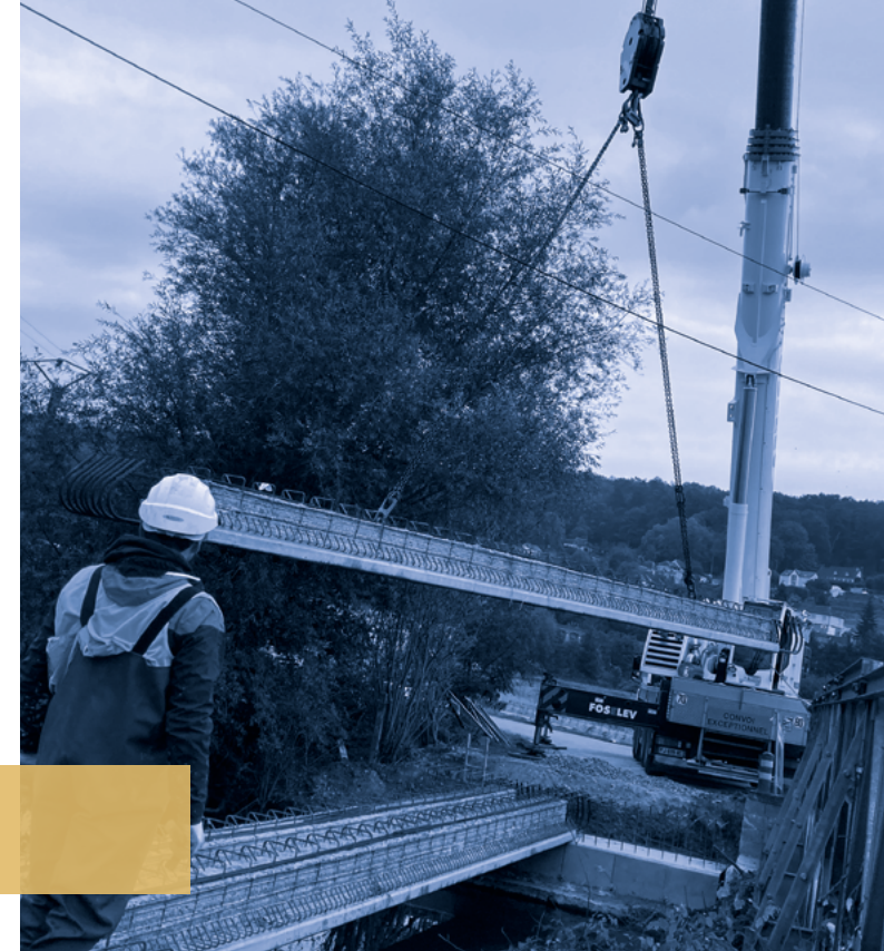
Un investissement de 350 000 euros a permis à la ville de Brionne de réaliser d'importants travaux de sécurisation du pont qui dessert la déchèterie.

de routes réalisés en enduits 40 communes ont été concernées en 2021 pour 99 routes différentes.