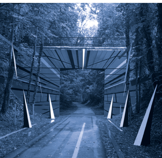
Electrik perspectives, œuvre de l'artiste Katre sur le parcours d'art urbain L'Artère, à Bernay.

d'art éphémère a vocation à tourner sur l'ensemble du territoire pour mettre en valeur un patrimoine naturel ciblé et sublimé par une pléiade d'artistes choisis. L'édition 2022, à Beaumontel, en est le parfait exemple.