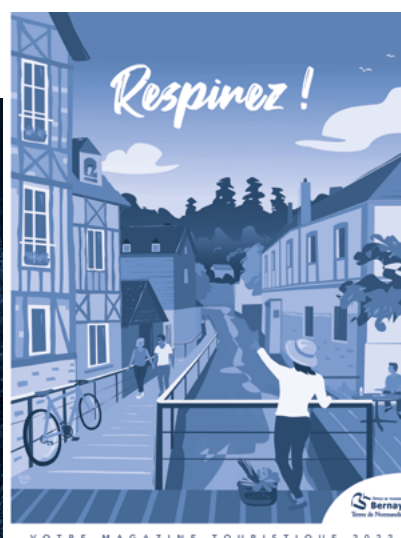
Illustration de la couverture du nouveau magazine de l'office de tourisme sorti au printemps 2022.