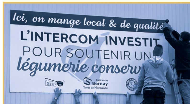
En faisant l'acquisition de l'ancien bâtiment Mayo (Bernay), l'Intercom aide à la création d'une légumier-conserverie, projet porté par le collectif les Petites L'Ouches. L'application de loyers modérés donne toutes ses chances à ce projet qui répond à une demande croissante de consommation de légumes en circuit court.

Afin de réduire les inégalités entre les habitants, le Président Nicolas Gravelle a demandé aux techniciens de trouver la bonne formule pour harmoniser les factures d'eaux usées et atteindre un tarif unique dès 2023. Ce lissage audacieux permet d'éviter des factures au m 3 variant du simple au triple. Assainissement toujours, l'Intercom s'est engagée dans un Plan pluriannuel d'investissement de 23 millions d'euros pour réaliser d'importants travaux sur le réseau – subvention de 10 millions d'euros (Agence de l'eau & Département). L'enveloppe a été utilisée à hauteur de 26 %, soit un montant de 6 millions d'euros dont 2 pour le boulevard Dubus à Bernay.