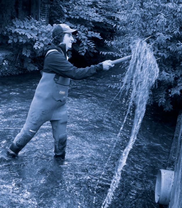
La gestion des cours d'eau et des zones humides fait partie des compétences de l'Intercom.