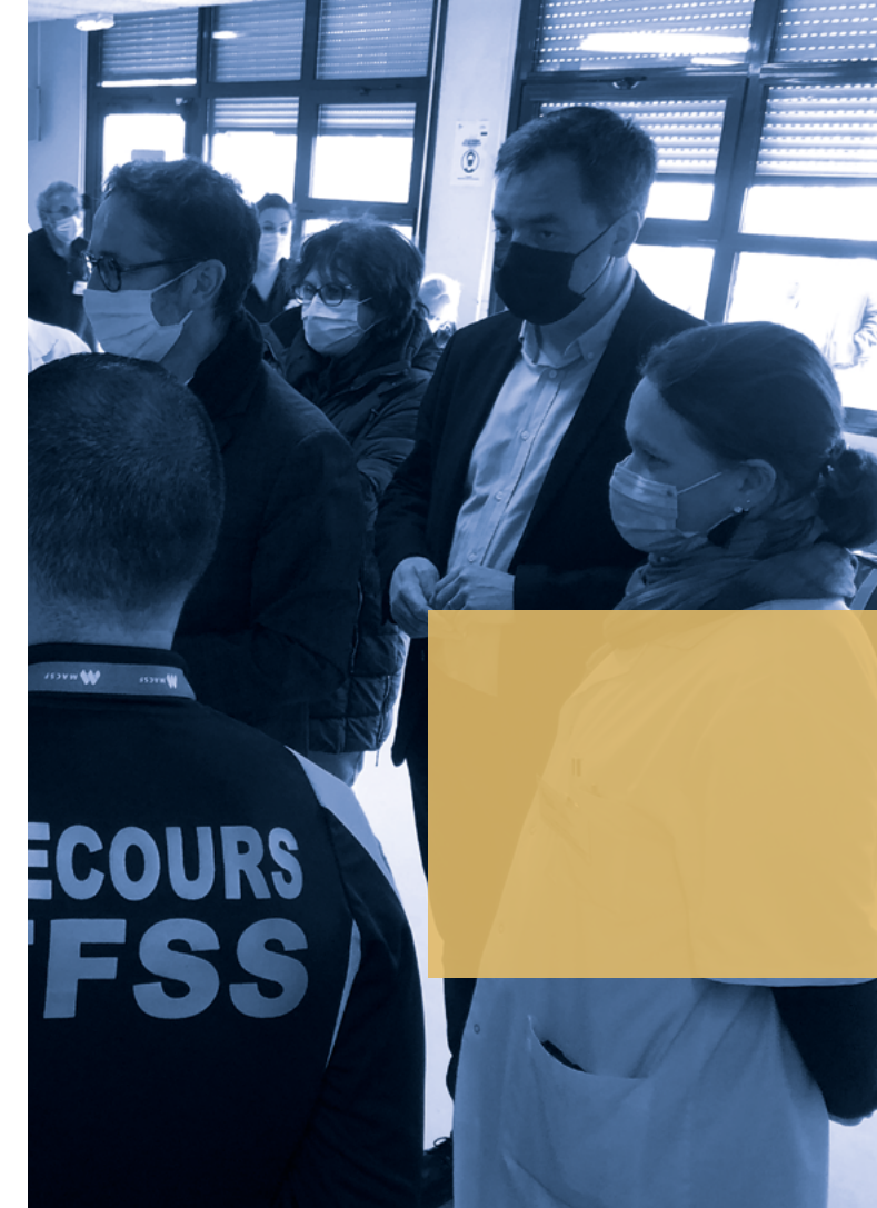
De mars 2021 à janvier 2022, la Ville de Bernay et l'Intercom Bernay Terres de Normandie ont uni leurs efforts pour accélérer la campagne de vaccination contre la Covid-19, en mettant en place un centre d'appels et de vaccination.

La crise sanitaire a montré, partout en France, la fragilité du système de santé. À l'échelle de l'Intercom, un Contrat Local de Santé (CLS) a donc été mis en place pour améliorer l'offre de santé de proximité. Autre action : la Région Normandie propose, aux chirurgiens-dentistes déjà installés, une aide pour l'achat d'un deuxième fauteuil dentaire destiné à la formation. L'objectif recherché : déclencher la volonté d'étudiants en dentisterie à exercer sur le territoire. Notre Intercom est la première, en Normandie, à pouvoir prétendre à cette aide.