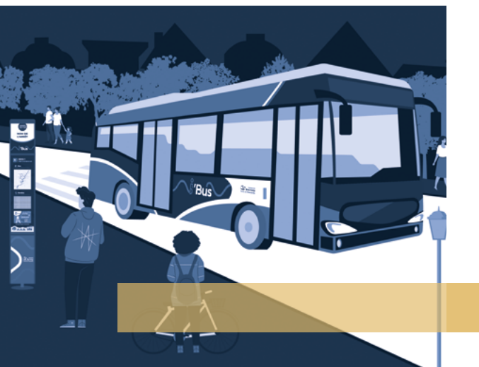
Transport urbain, un nouveau service intercommunautaire.