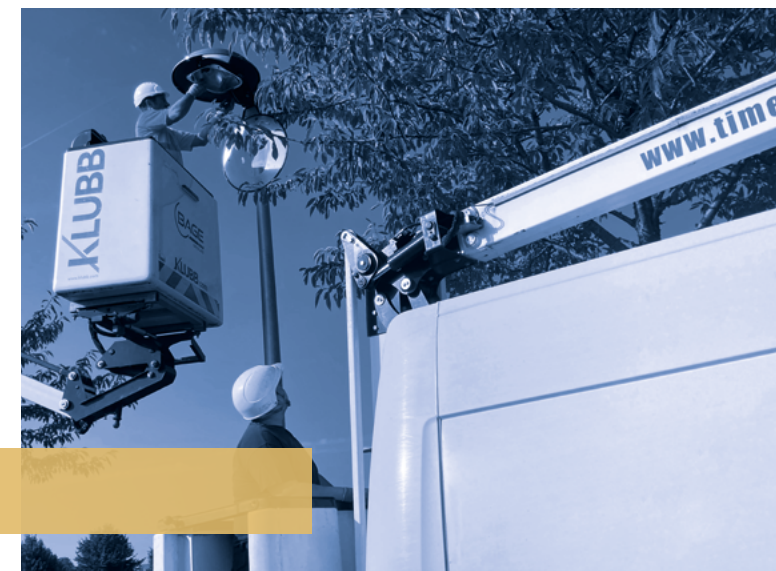
Travaux sur la ZAC des Granges. Objectif : sécuriser les lieux par un éclairage à LED performant et plus respectueux de l'environnement. Cette installation améliore l'accès, de nuit, aux entreprises implantées sur la zone.

A ide au lancement d'un nouveau club d'entreprises, le Cercle des entrepreneur-e-s de Bernay et son territoire (soutien financier Intercom et Région via son agence de développement) : un succès vertigineux avec 130 adhérents en moins d'un an ; aide logistique au club historique du GIAB (Groupement interprofessionnel de l'arrondissement de Bernay) pour l'événement #Les gestes de nos métiers ; nouvelle stratégie tarifaire pour la vente de parcelles des parcs d'activités (ZAC) encore disponibles, en fonction de critères objectifs (emplacement, visibilité, taille et nombre d'emplois créés du pétitionnaire, etc.).