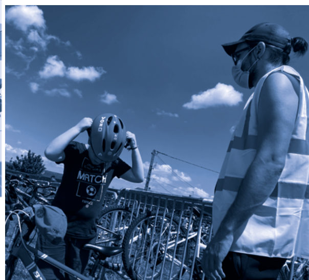
Le triathlon scolaire réunit près de 900 élèves du territoire chaque année.